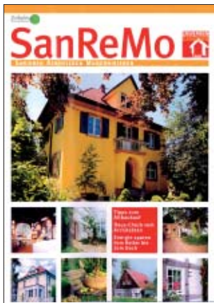
Zeitschrift: Sanieren – Renovieren – Modernisieren – Kaufen